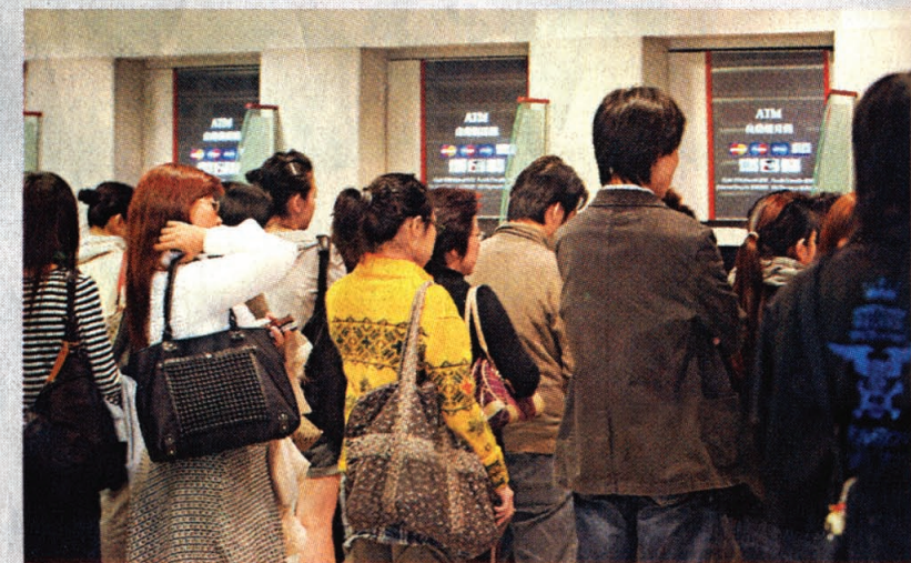
假金牛湧現，不少市民大為緊張，紛紛將金牛存入戶口。