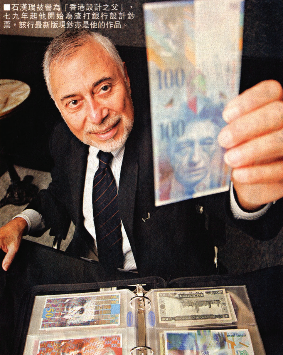
石漢瑞被譽為「香港設計之父」，七九年起他開始為渣打銀行設計鈔票，該行最新版現鈔亦是他的作品。

「這技術可代替現金，在香港，今天就可實行了！我們的系統已十分完善，如在便利店，現時用八達通，甚麼都買得到，你又可以用手機控制銀行戶口，將款項傳到世界任何地方，還有信用卡等等，只要將密碼密碼就行了。你知道紙幣是由中國人發明的嗎？當時有這樣一個故事，馬可孛羅從中國回到歐洲時，告訴其他人中國人發明了紙幣，聽的人都不相信他，還取笑他呢。但不是不可能的，你看，由以物易物，到錢幣和紙幣，而下一步，將會是智能卡、電子貨幣。」